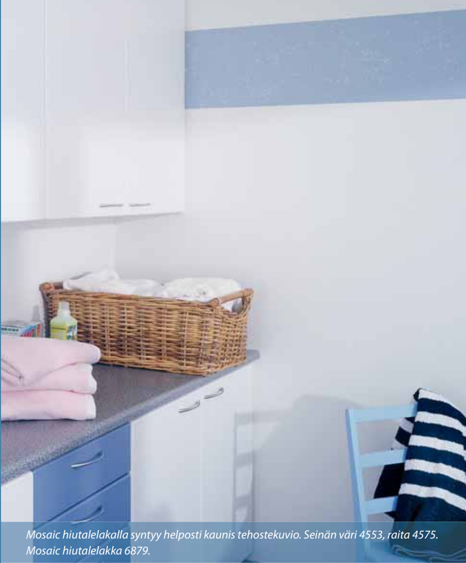
Mosaic hiutalelakalla syntyy helposti kaunis tehostekuvio. Seinän väri 4553, raita 4575. Mosaic hiutalelakka 6879.