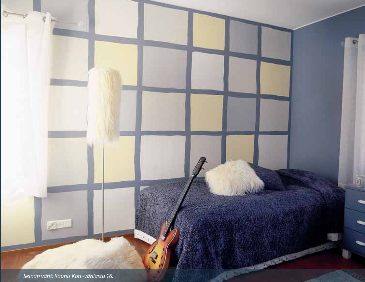
Seinän värit: Kaunis Koti -värilastu 16.