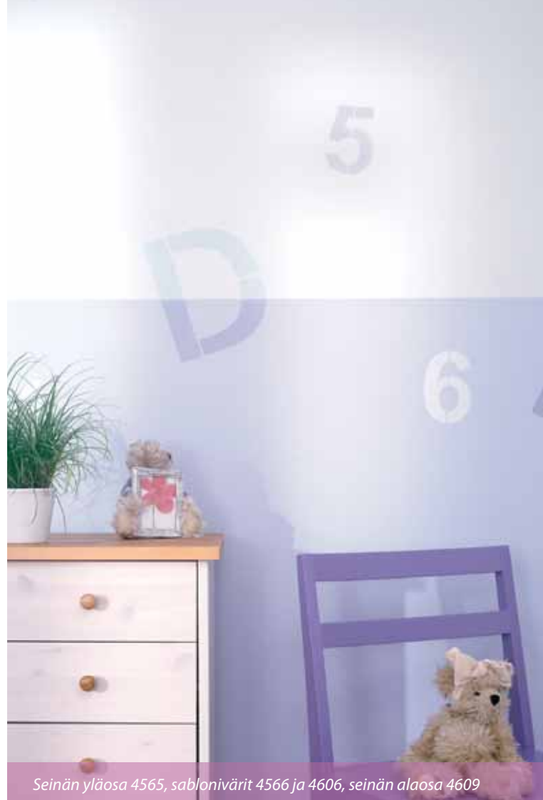
Seinän yläosa 4565, sablonivärit 4566 ja 4606, seinän alaosa 4609

Koululaisille jäävät kirjaimet paremmin mieleen, kun ne maalataan suoraan seinään.