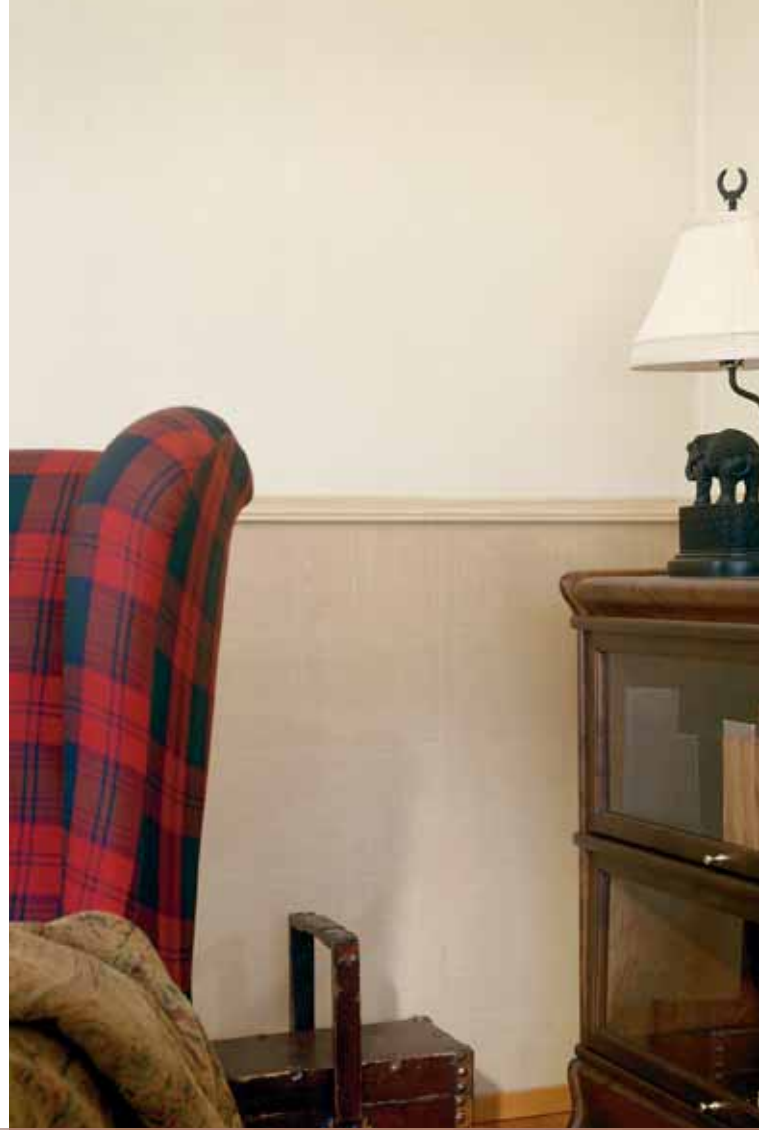
Tunto Hieno -pinta väripestiin sienellä.