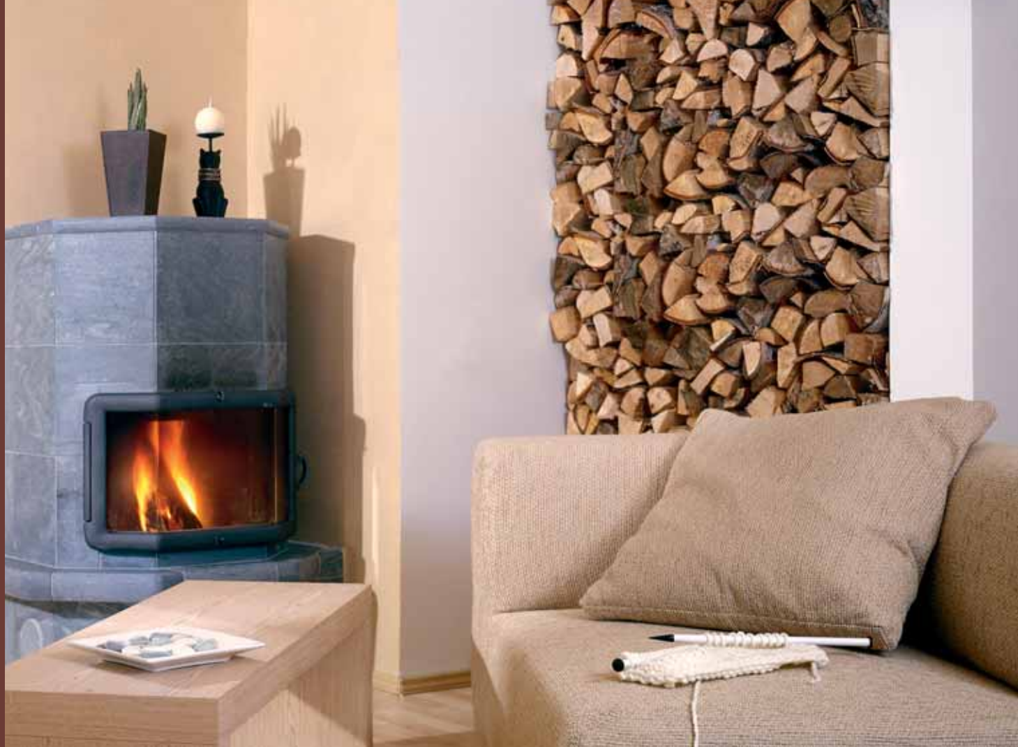
Takkahuoneen pehmeä, akvarellimainen tunnelma luotiin väripesemällä huokoinen Tunto Hieno -pinta Kaunis Koti Kuviointimaalilla, väri 4689.