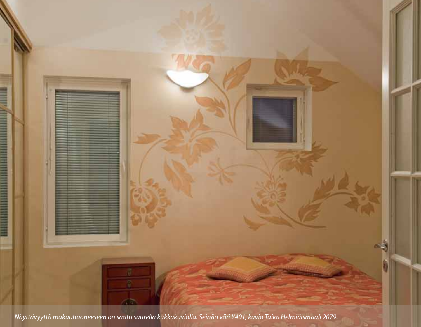
Näyttävyyttä makuuhuoneeseen on saatu suurella kukkakuviolla. Seinän väri Y401, kuvio Taika Helmiäismaali 2079.