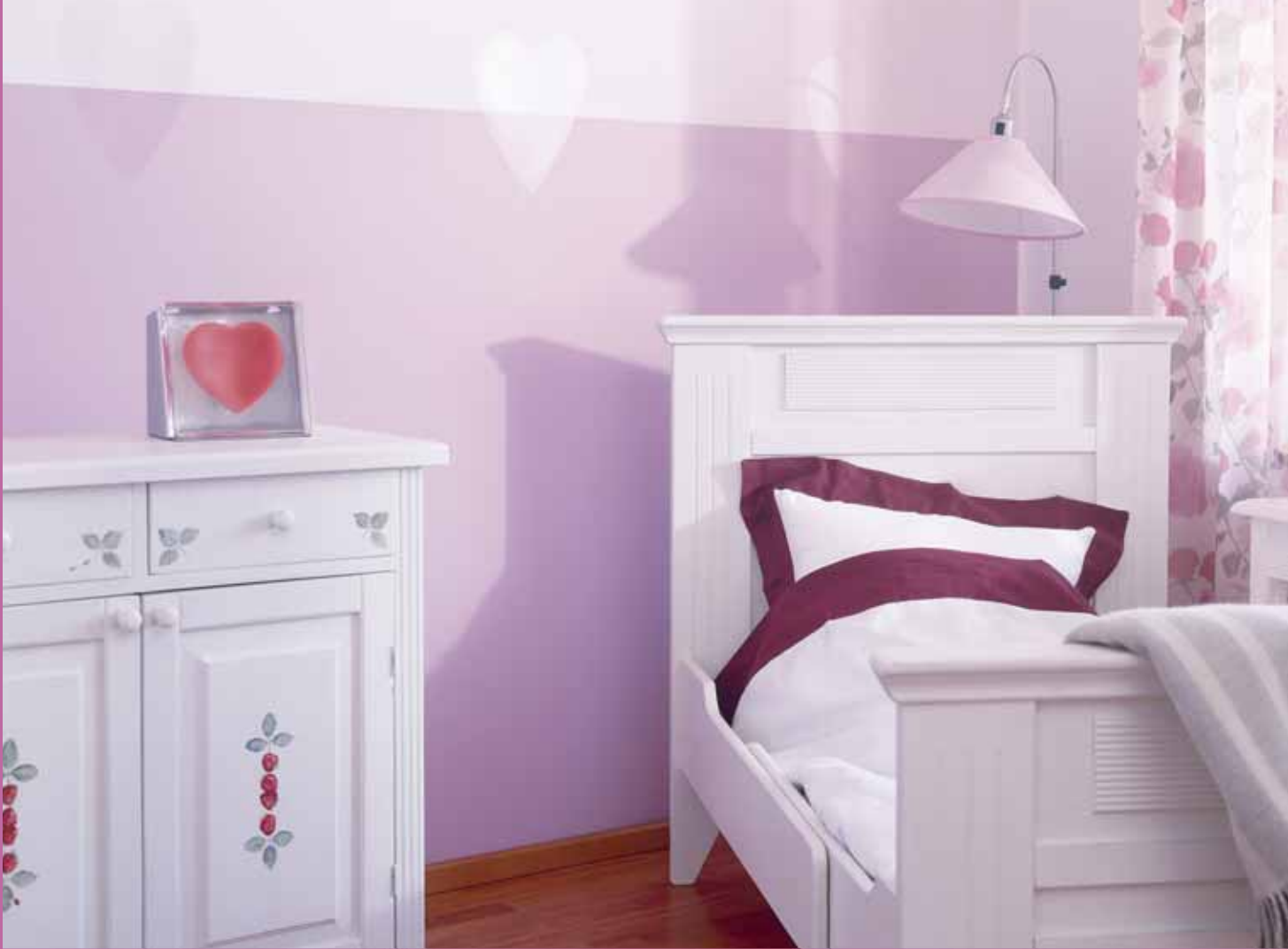
Jännittävä kontrasti syntyi, kun sablonikuviot tehtiin kiiltävällä lakalla himmeälle pohjalle. Seinän yläosa F342, alaosa H342. Sydämet Kiva Kalustelakka.