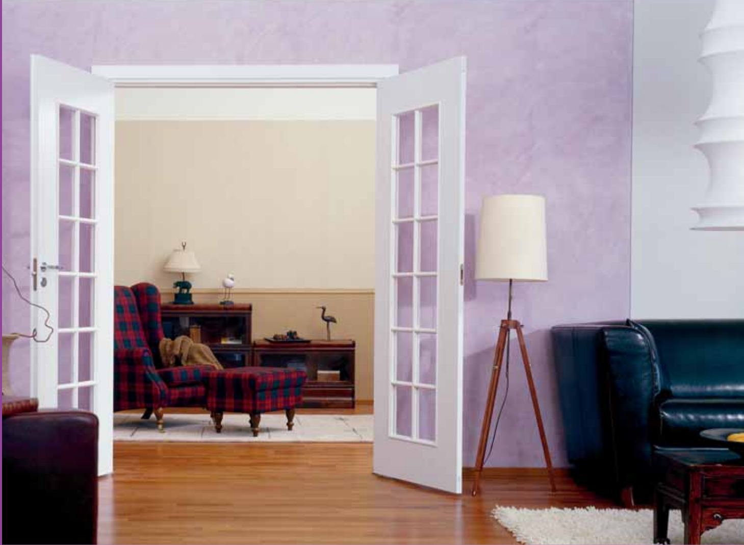
Akvarellimainen pinta voi olla värivalinnoista riippuen joko pehmeän utuinen tai tehokkaan intensiivinen. Seinän pohjaväri 4531, väripesu 4610.