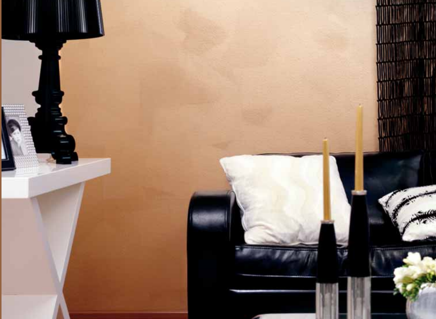
Pehmeä vaikutelma syntyi ristiin rastiin telauksella. Taika helmiäismaalin sävy Sole 2079.