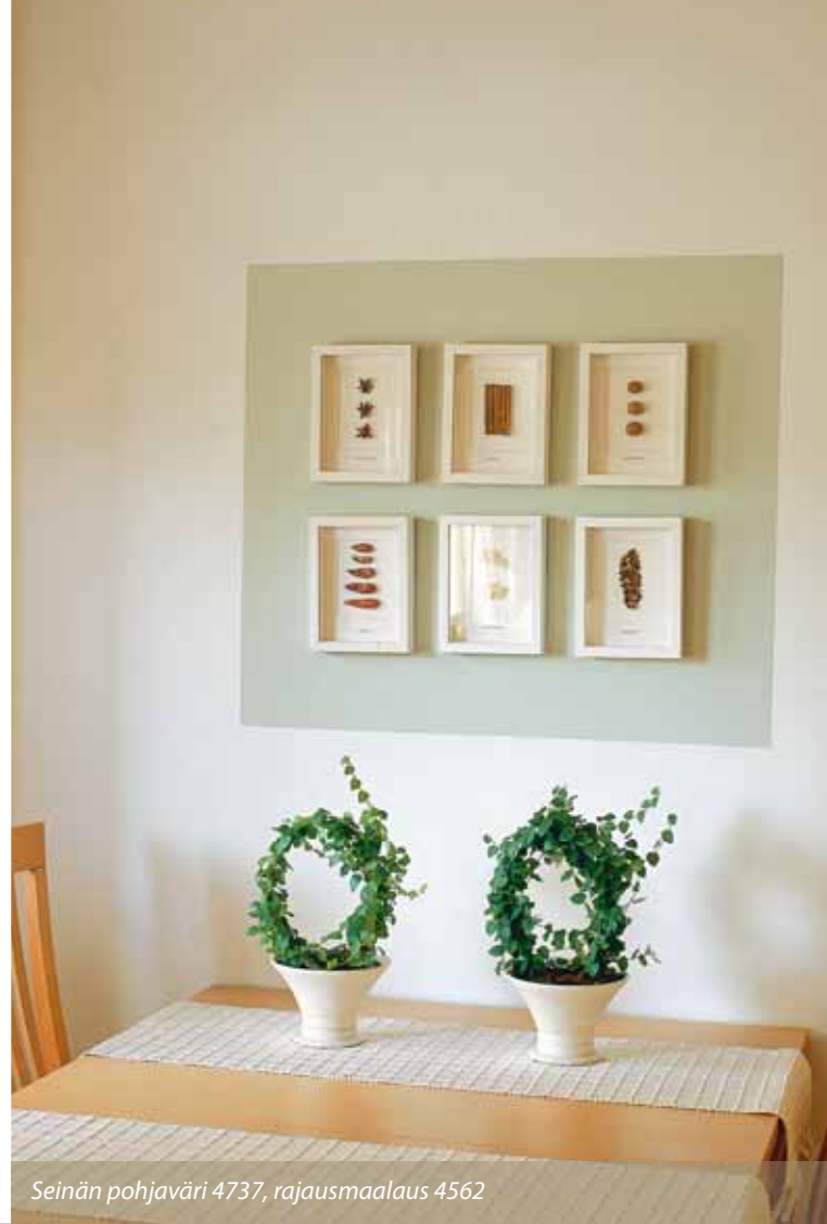
Seinän pohjaväri 4737, rajausmaalaus 4562