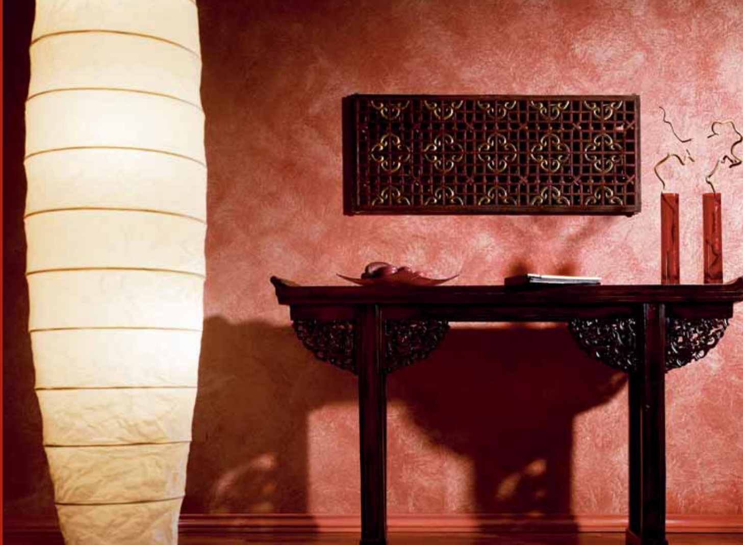
Lämmin itämainen tunnelma syntyi kuviointitelalla ja Kaunis Koti -kuviointimaalilla. Seinän pohjaväri 4621, kuviointiväri 4622.