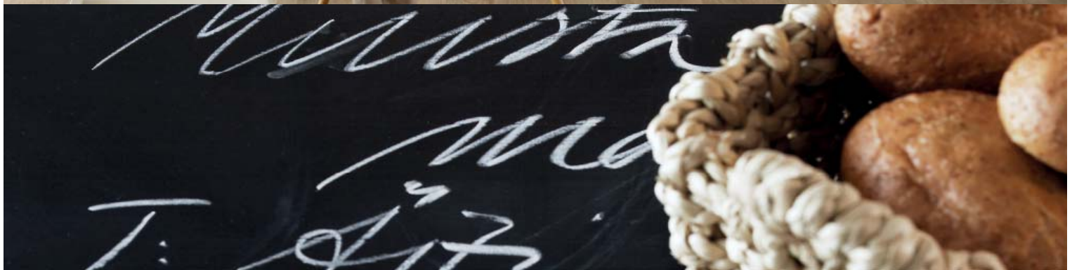
Pöydän pinta viimeisteltiin Koulutaulumaalilla keittiön eläväksi muistilistaksi. Valkoisissa osissa Helmi-kalustemaalilla F497 Paperi.

Värit ovat viitteellisiä, tarkista värit Tikkuilan värikartoista.