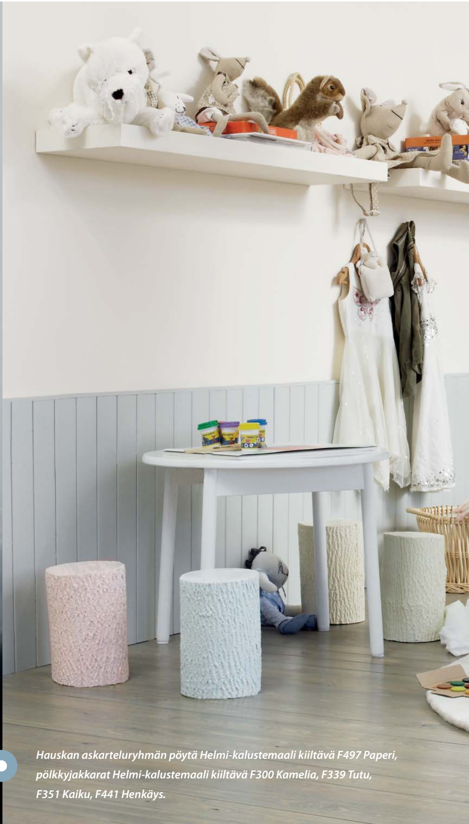
Hauskan askarteluryhmän pöytä Helmi-kalustemaali kiiltävä F497 Paperi, pölkkyjakkarat Helmi-kalustemaali kiiltävä F300 Kamelia, F339 Tutu, F351 Kaiku, F441 Henkäys.