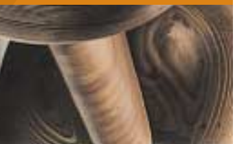
Dicco Color Petstivärikartta Betstivärikartta Stain Colour Card